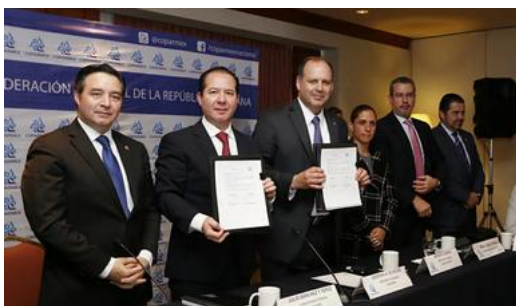
COFEPRIS Y COPARMEX FIRMAN CONVENIO PARA IMPULSAR ACCIONES EN SALUD