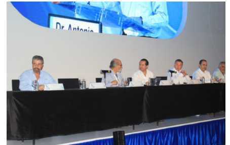
Industria farmacéutica, estratégica en la economía nacional: COFEPRIS