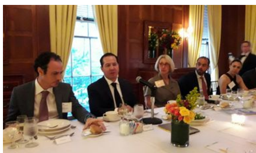
Expone COFEPRIS ante el Consejo de las Américas los avances de México en la Agenda Regulatoria

Comunicado 047 - El Comisionado Federal Julio Sánchez y Tépoz se reunió con integrantes del Consejo de las Américas, en la ciudad de Nueva York. Participaron ejecutivos de las principales industrias de Estados Unidos. El encuentro permitió fortalecer el diálogo para promover oportunidades de colaboración en materia de protección de la salud pública.