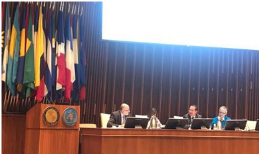
El encuentro agrupa a autoridades sanitarias de Argentina, Brasil, Canadá, Colombia, Cuba, Chile, Estados Unidos y México

Comunicado 105 - El encuentro agrupa a autoridades sanitarias de Argentina, Brasil, Canadá, Colombia, Cuba, Chile, Estados Unidos y México. El objetivo, fortalecer la cooperación para la regulación de productos farmacéuticos en la región de las Américas